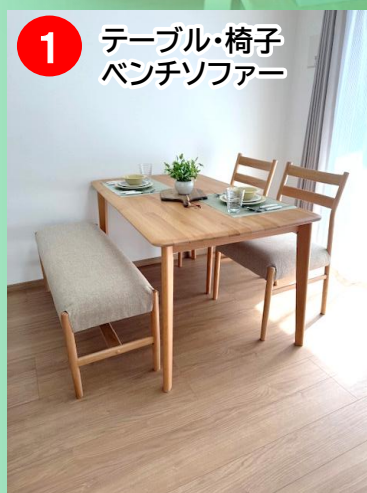
1 テーブル・椅子 ベンチソファ

【その他家具】LEDシーリングライト×2、カーテン・レースカーテン、ラグマット、小物