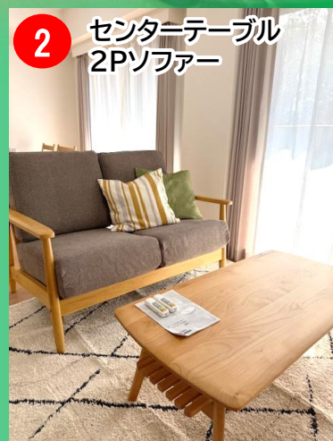
2 センターテーブル 2Pソファ