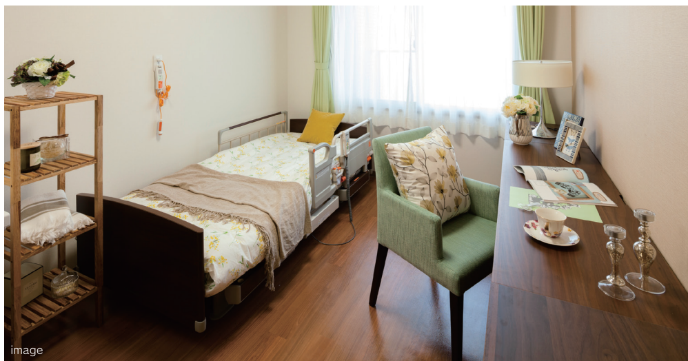
■居室一例 | 21号室(18.00㎡)