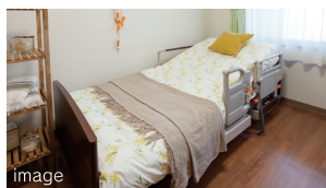
1 介護ベッド(電動式)