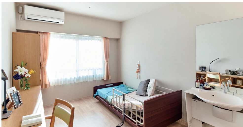
■居室一例 | 22号室 (19.52㎡)