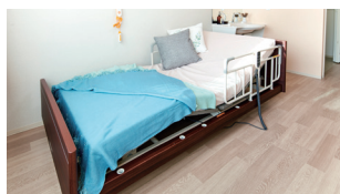
1 介護ベッド(電動式)