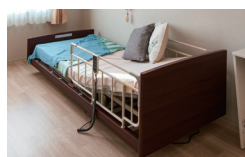
2 介護ベッド(電動式)