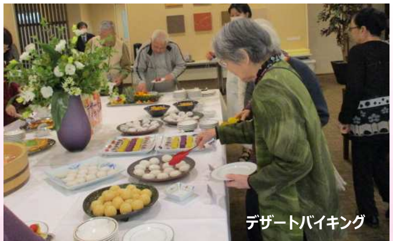
デザートバイキング