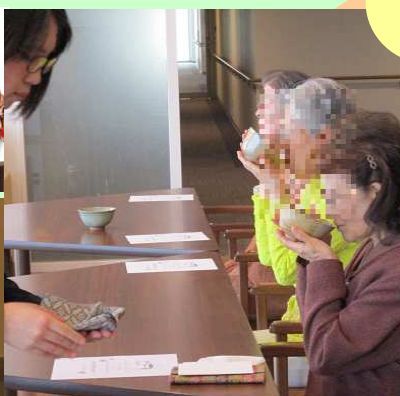
美味しくいただきました