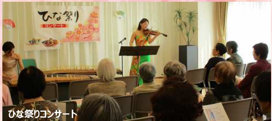
ひな祭りコンサート