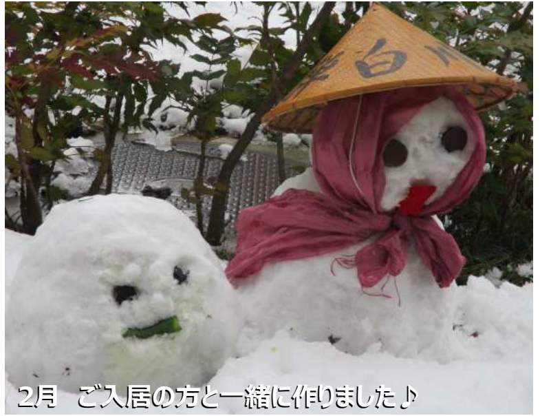
2月 ご入居の方と一緒に作りました♪