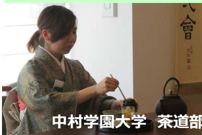
中村学園大学 茶道部