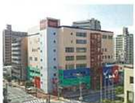
コナミスポーツクラブ城南