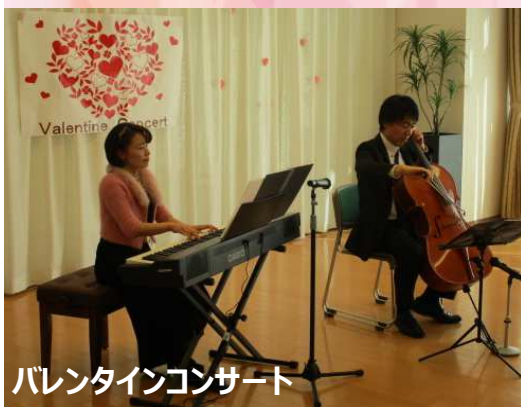
バレンタインコンサート