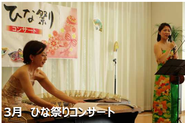
3月 ひな祭りコンサート