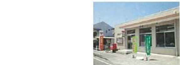
福岡田島三郵便局